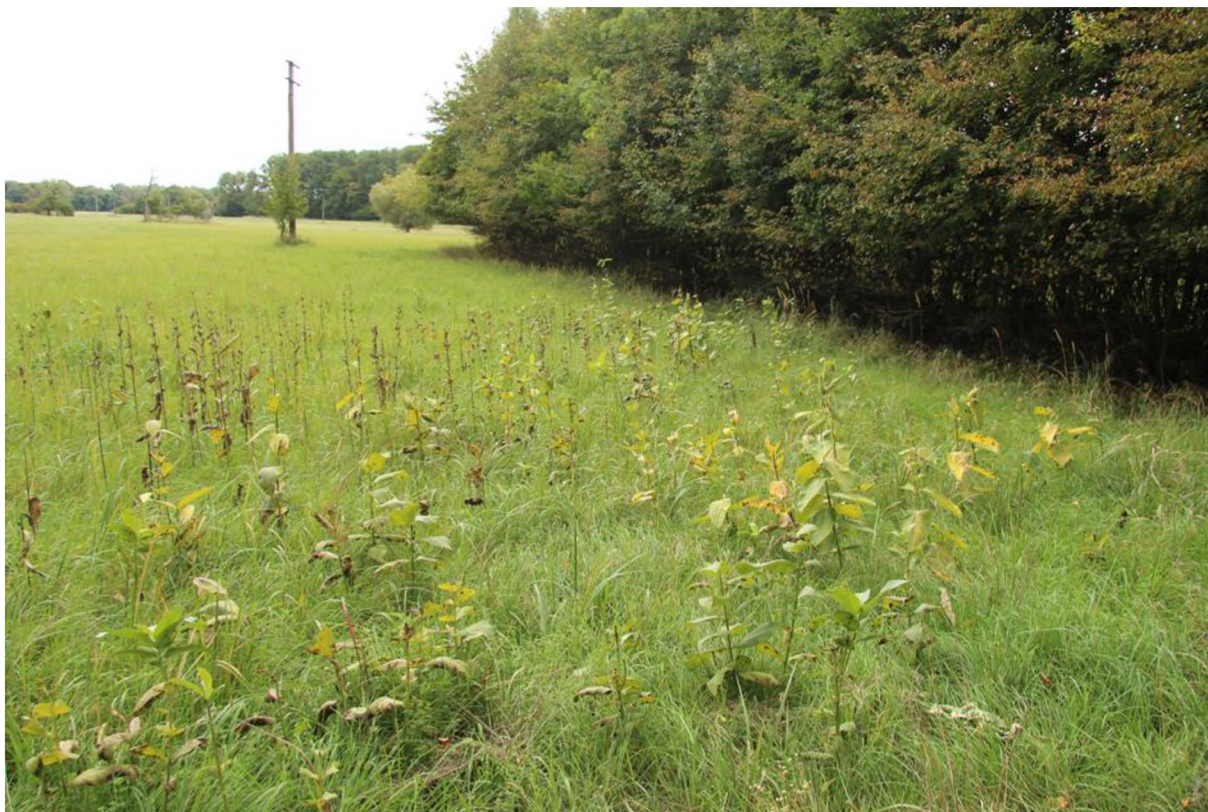
střední hustota klejichy