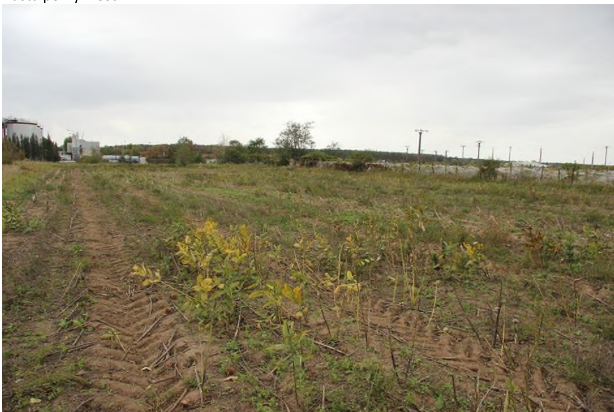
chybějící listy mohou značně ovlivnit vnímání hustoty porostu. zde se jedná o hustou pokryvnost