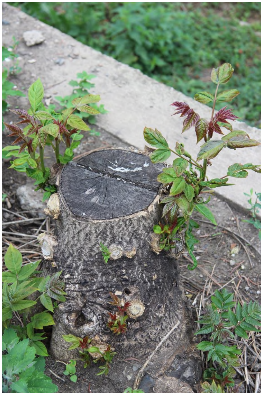
Nedostatečně ošetřený pařez pajasanu s regenerací na pařezu a kořenech.