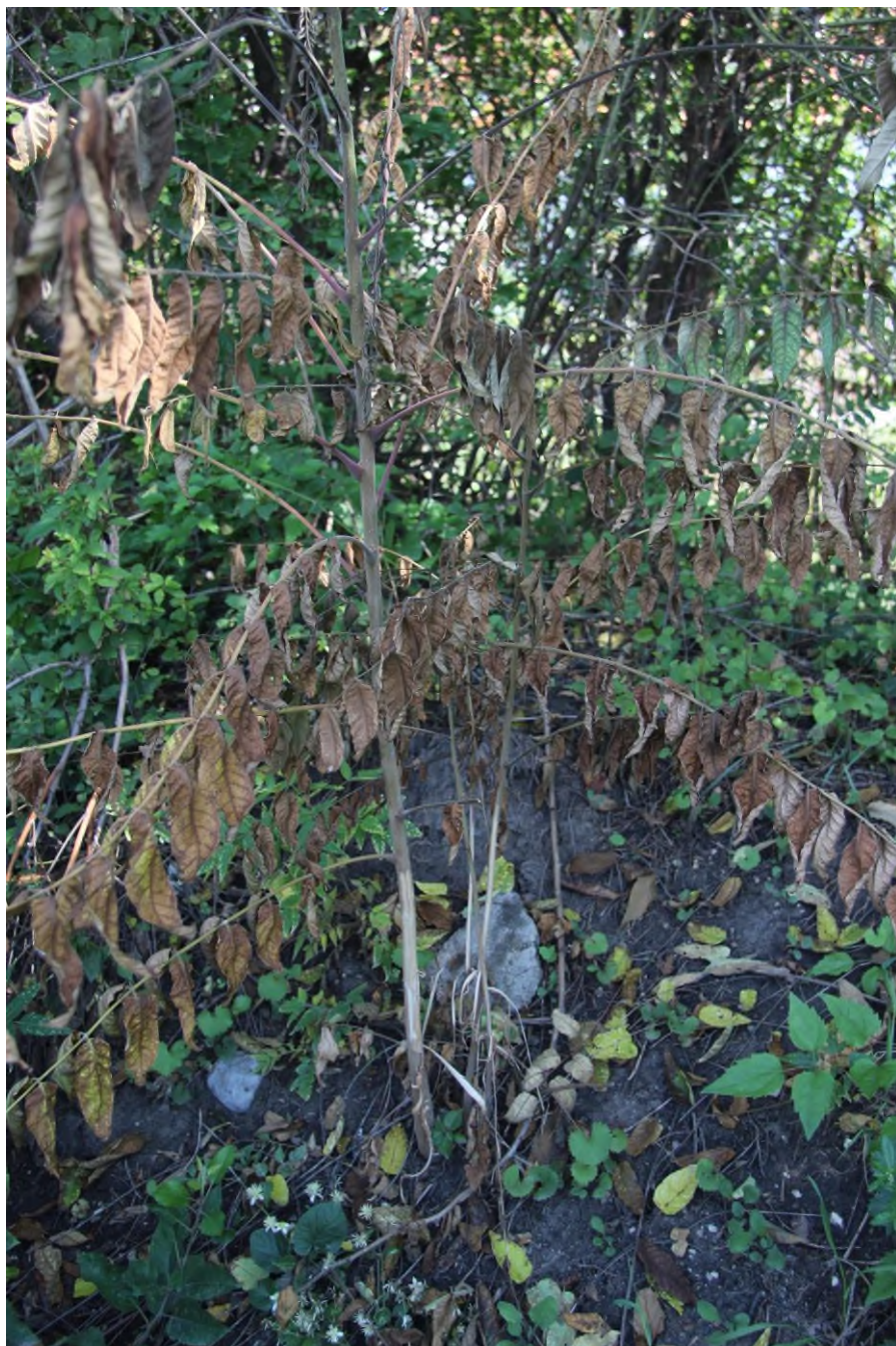
Detail ošetření mladých jedinců pajasanu s odstraněním části kůry a zatřením herbicidem.