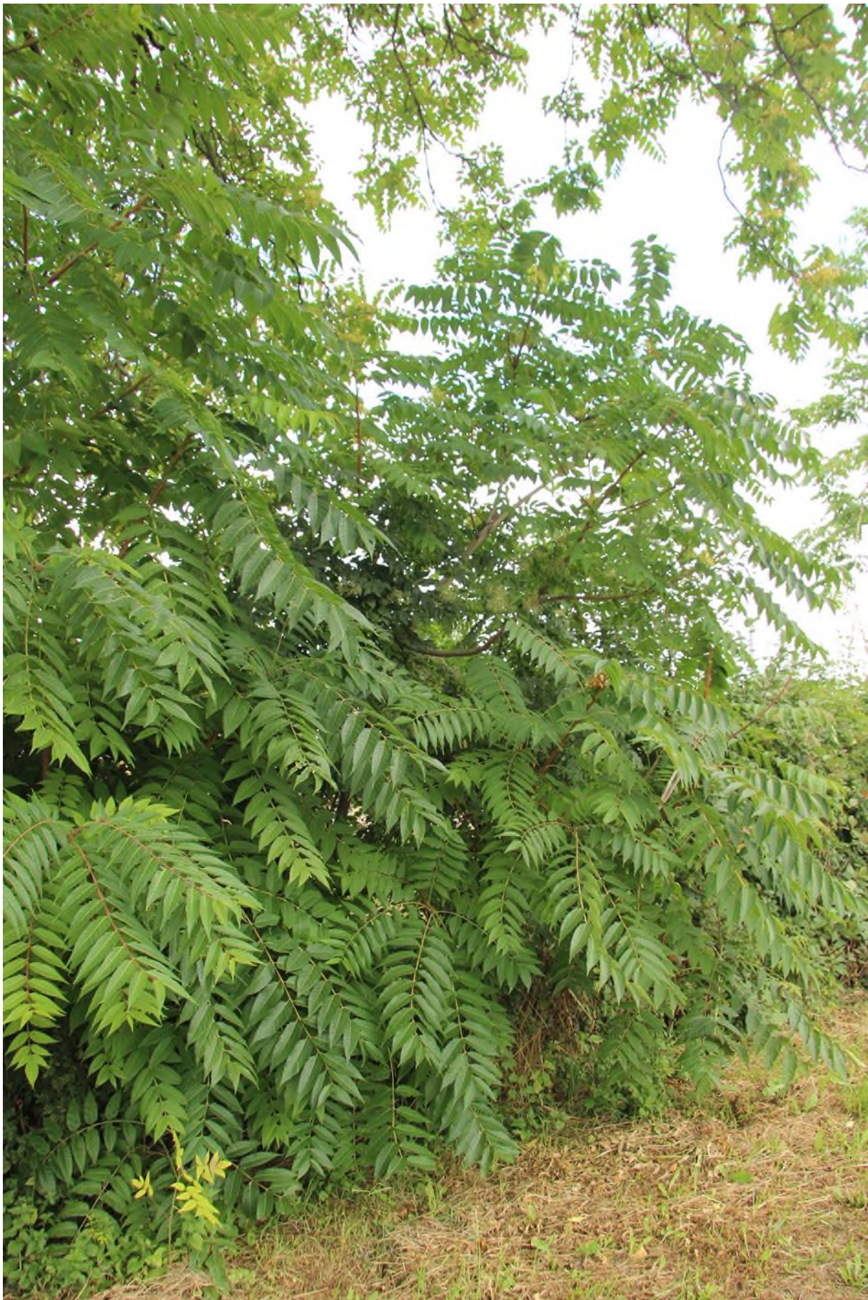
liniový porost pajasanu podél plotu, vzhledem k vysokému počtu semenáčků a výhonů se jedná o hustý porost