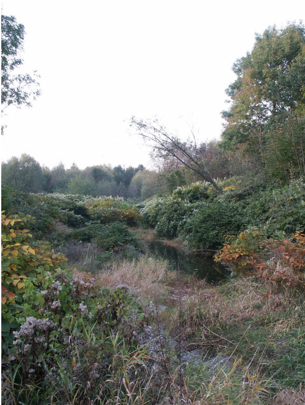
polykormony křídlatky s hustou abundancí