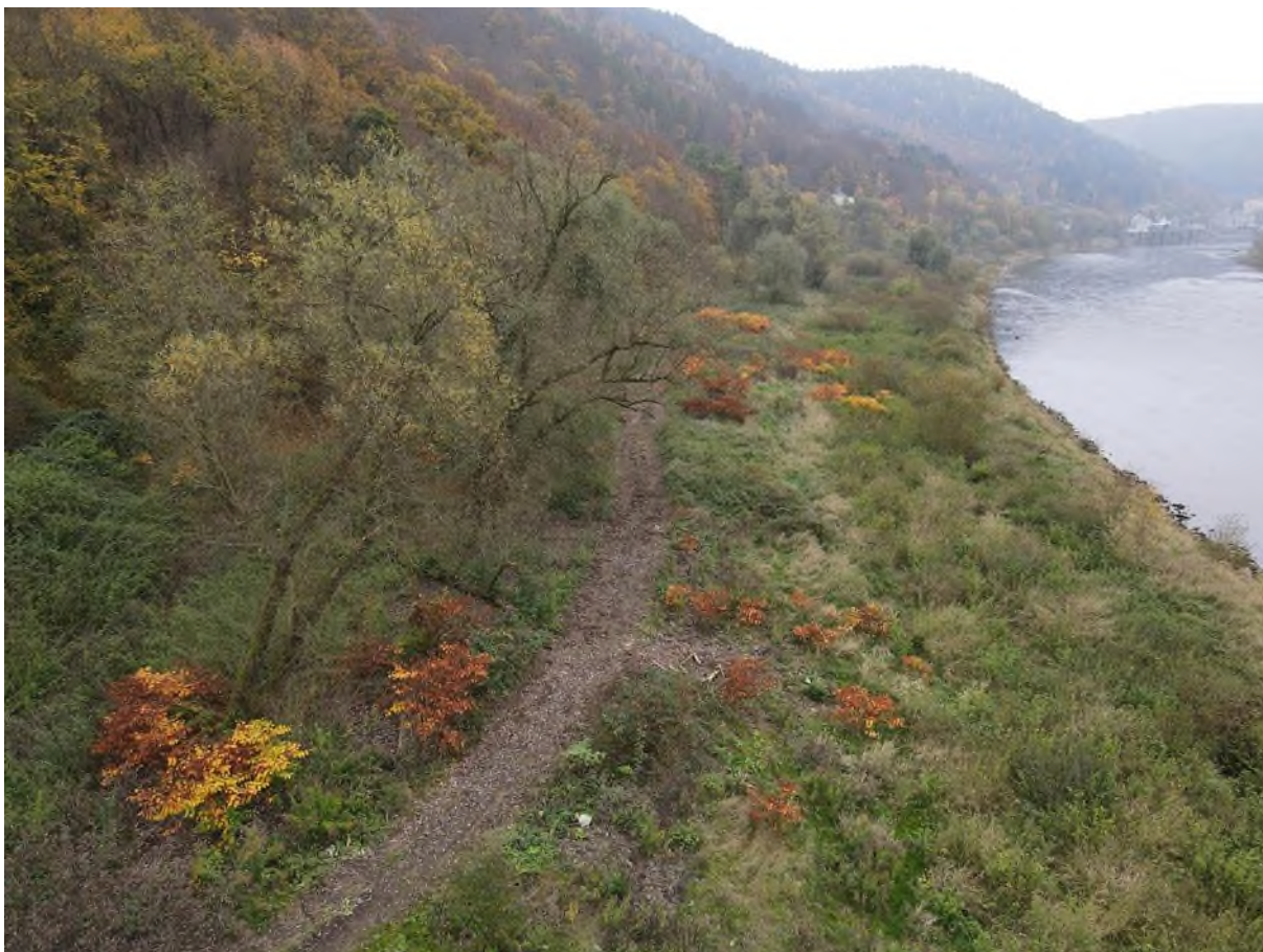
křídlatka viditelná jako rezavé porosty. v tomto případě se jedná o kombinaci střední a husté abundance. pro zřetelnost zákres v kopii obrázku (zákres jen polykormonů v popředí)