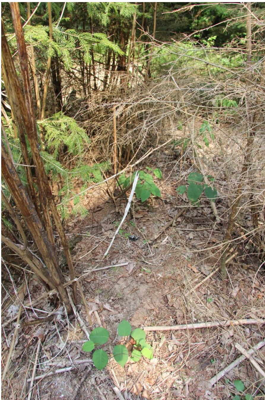
V ploše ošetřené herbicidem dochází k i přes správný postup k regeneraci. Regenerující výhonky je třeba ošetřit.