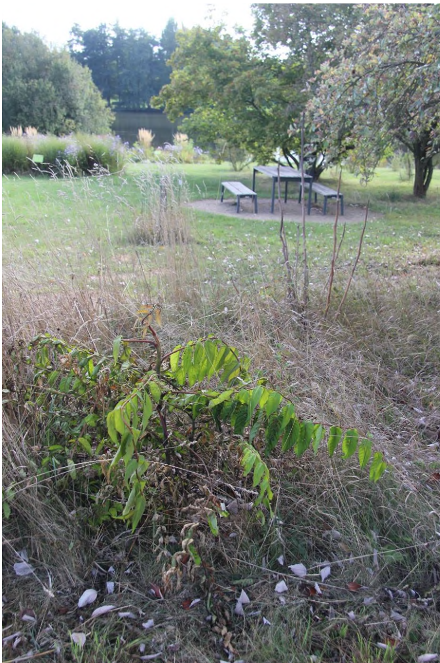
Ošetřený mladý jedinec postřikem. Jedná se o přístup možný, ale s riziky na okolí. Také účinnost nemusí být tak efektivní.